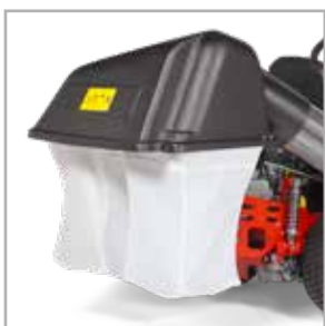
Grasopvangsysteem met 2 zakken