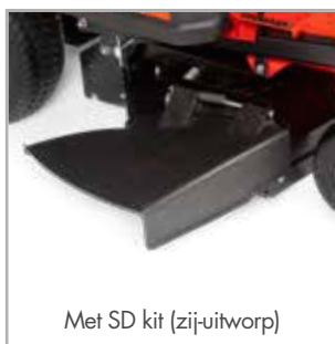
Met SD kit (zij-uitworp)