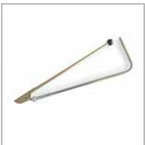
Afvoertunnelschraper (SLC & SYC)