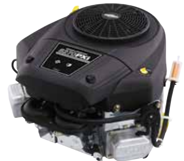
BRIGGS & STRATTON® MOTOR De Briggs & Stratton 8270 PXi motor is uitgerust met een oliefilter en druksmering.