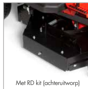
Met RD kit (achteruitworp)