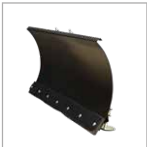
Schneeräumschild 120 cm (SLC & SYC)