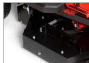
Mit eingebautem Heckauswurfsatz