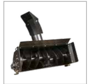
Schneefräse 100 cm(SYC)