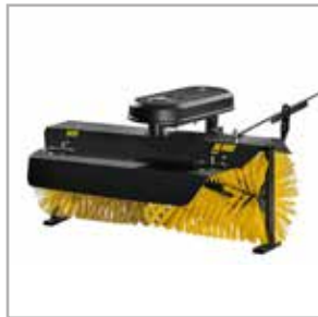
Bürstenwalze 120 cm (SYC)