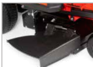
Mit angebautem SeitenauswurfKit