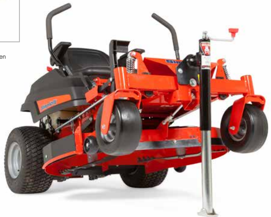
SERVICEBUCHSE Für den einfachen Wartungszugang auf der Unterseite des Mähwerks.