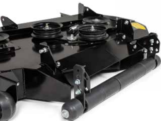
STREIFENZUGWALZE ROLLEN-KIT* Ein gut gepflegter Rasen verdient perfekte Streifen.